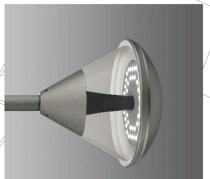
Nuovi corpi illuminanti su poli esistenti e recuperati

N.B. La planimetria fogli nati è indicativa e dovrà essere verificata in sito o cura dell'Appaltatore