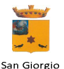
San Giorgio Ionico