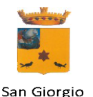
San Giorgio Ionico